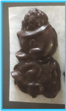
Un canard (40 gr) : 1 pour 2$ ou 3 pour 5$