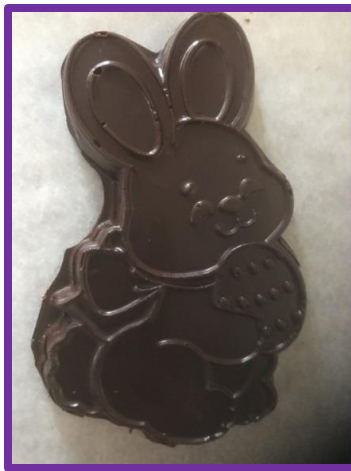
Un lapin (75 gr) : 1 pour 3$ ou 2 pour 5$