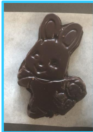
Petit lapin (35 gr) : 1 pour 1,50$ ou 4 pour 5$