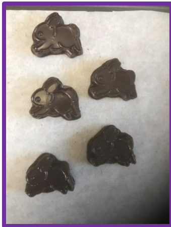
Petits lapins coureur (sac de 100 gr): 1 pour 5$ ou 3 pour 12$