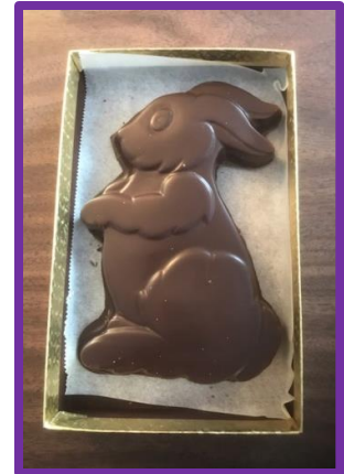
Gros lapin (210 gr) : Dans une boîte pour 10 $

Note : Le poids des chocolats peut varier quelque peu